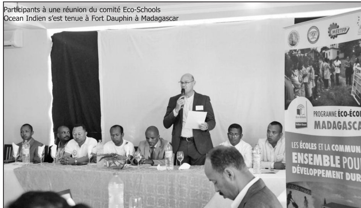
Participants à une réunion du comité Eco-Schools Ocean Indien s'est tenue à Fort Dauphin à Madagascar